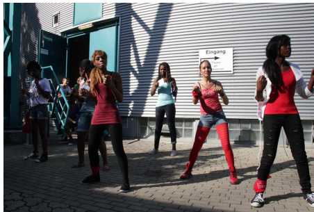
Schülerinnen proben weiter in der Pause.